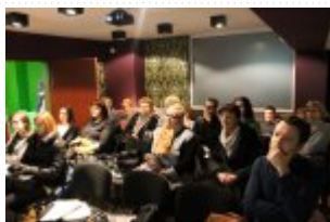
Hostel "La Granda" prowadzony przez Spółdzielnię Socjalną ISSA