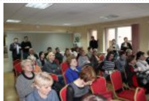
Ośrodek Szkoleniowy "Kłos"