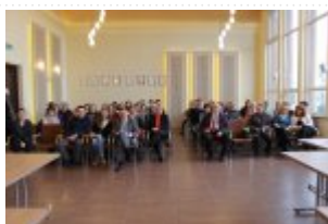
Uczestnicy wizyty studyjnej