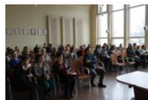
Urząd Miasta Brzeziny