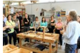
21 maja 2014 r. - Wizyta w Comunity Centre Seebach #7