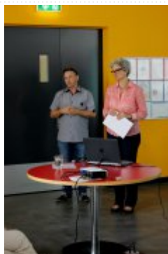
20 maja 2014r. - Wizyta w Stiftung Zuriwerk #5