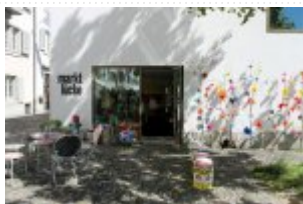
20 maja 2014r. - Wizyta w Marktlucke #1