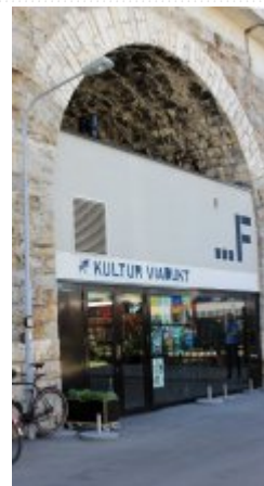
21 maja 2014 r. - Wizyta w Impact Hub Zurich #3