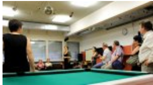
21 maja 2014 r. - Wizyta w Comunity Centre Seebach #5