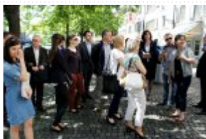
20 maja 2014r. - Wizyta w Marktlucke #2