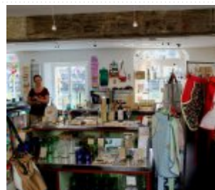
20 maja 2014r. - Wizyta w Marktlucke #3