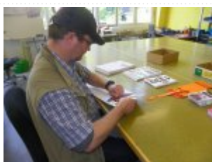
20 maja 2014r. - Wizyta w Stiftung Zuriwerk #2