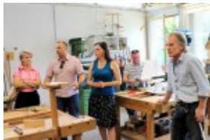
21 maja 2014 r. - Wizyta w Comunity Centre Seebach #8