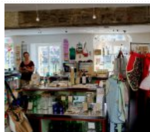
20 maja 2014r. - Wizyta w Marktlucke #3