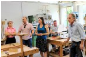
21 maja 2014 r. - Wizyta w Comunity Centre Seebach #8