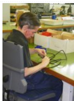
20 maja 2014r. - Wizyta w Stiftung Zuriwerk #3