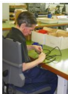
20 maja 2014r. - Wizyta w Stiftung Zuriwerk #3