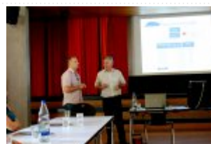
21 maja 2014 r. - Wizyta w Comunity Centre Seebach #1