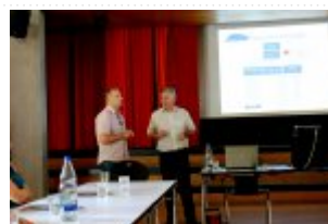
21 maja 2014 r. - Wizyta w Comunity Centre Seebach #1