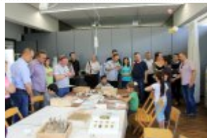
21 maja 2014 r. - Wizyta w Comunity Centre Seebach #9