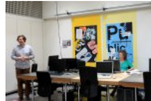
21 maja 2014 r. - Wizyta w Comunity Centre Seebach #4