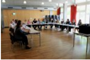
21 maja 2014 r. - Wizyta w Comunity Centre Seebach #2