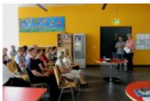
20 maja 2014r. - Wizyta w Stiftung Zuriwerk #4