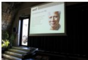
21 maja 2014 r. - Wizyta w Impact Hub Zurich #1