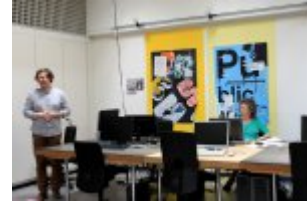
21 maja 2014 r. - Wizyta w Comunity Centre Seebach #4