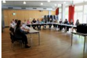
21 maja 2014 r. - Wizyta w Comunity Centre Seebach #2