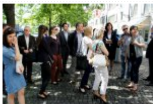
20 maja 2014r. - Wizyta w Marktlucke #2