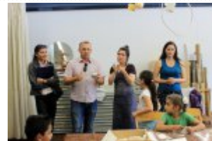
21 maja 2014 r. - Wizyta w Comunity Centre Seebach #10