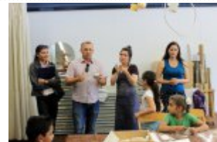
21 maja 2014 r. - Wizyta w Comunity Centre Seebach #10