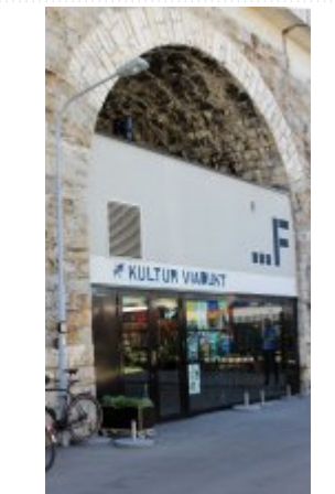
21 maja 2014 r. - Wizyta w Impact Hub Zurich #3