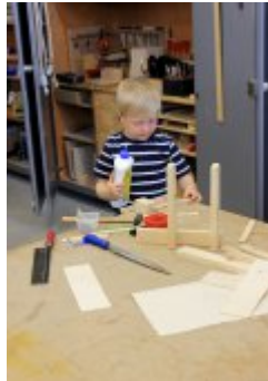
21 maja 2014 r. - Wizyta w Comunity Centre Seebach #6