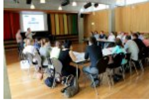
21 maja 2014 r. - Wizyta w Comunity Centre Seebach #3