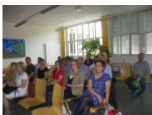
20 maja 2014r. - Wizyta w Stiftung Zuriwerk #1