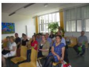
20 maja 2014r. - Wizyta w Stiftung Zuriwerk #1