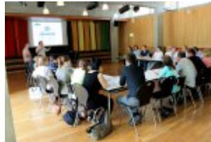
21 maja 2014 r. - Wizyta w Comunity Centre Seebach #3