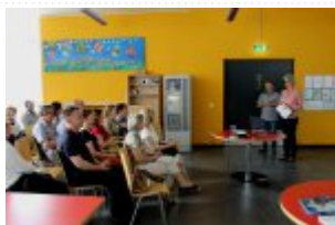
20 maja 2014r. - Wizyta w Stiftung Zuriwerk #4