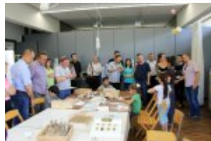
21 maja 2014 r. - Wizyta w Comunity Centre Seebach #9