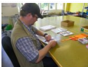
20 maja 2014r. - Wizyta w Stiftung Zuriwerk #2