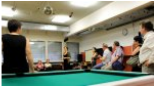
21 maja 2014 r. - Wizyta w Comunity Centre Seebach #5